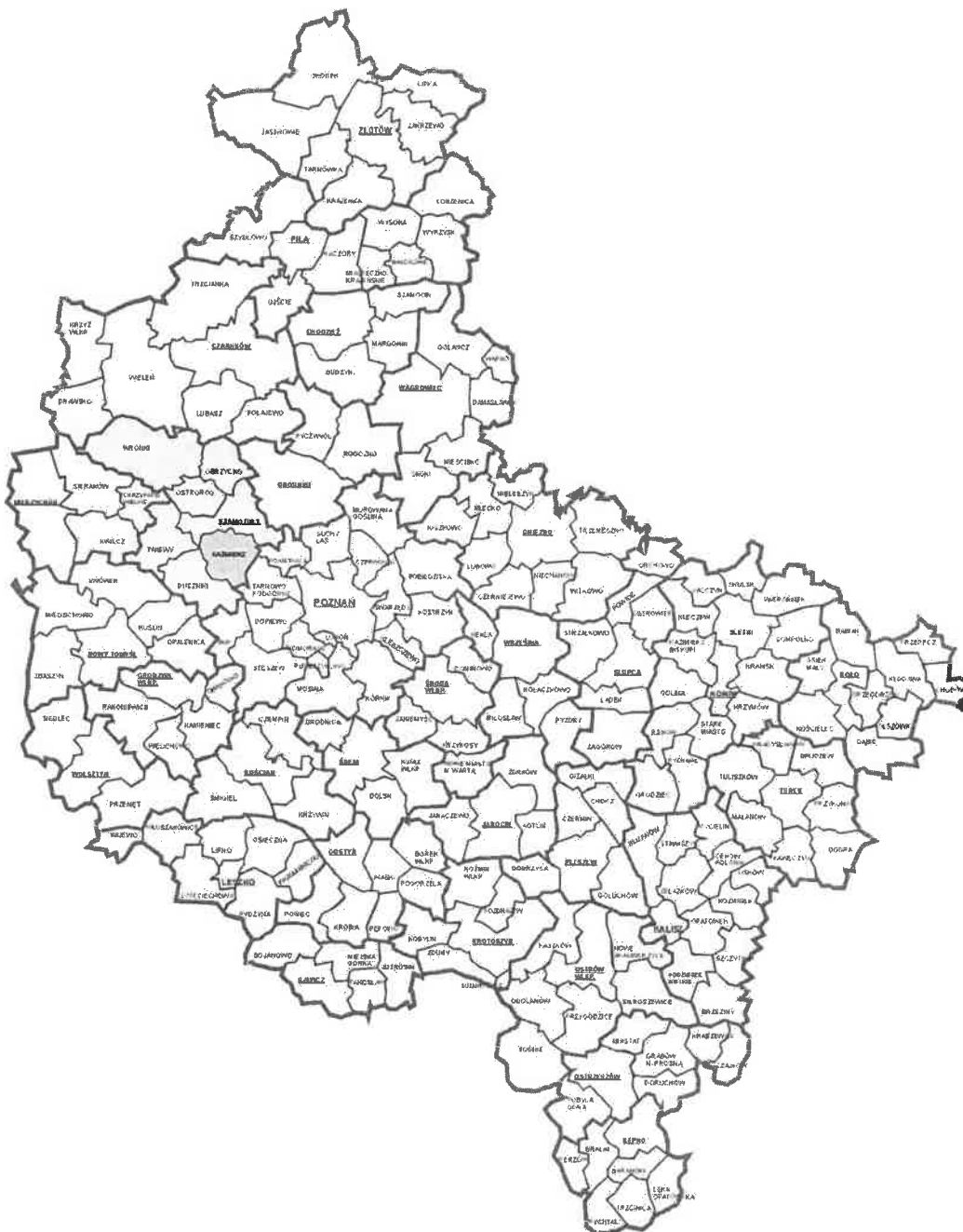
Mapa 1. Podział administracyjny województwa wielkopolskiego,

Siedziba władz gminy znajduje się w Kaźmierzu – położonej centralnie miejscowości zamieszkiwanej przez blisko 5000 mieszkańców. Gmina Kaźmierz przez wiele lat była typową gminą wiejską o charakterze rolniczym. Procesy suburbanizacyjne ostatnich lat spowodowały, iż obecnie dominującą funkcją gminy jest funkcja mieszkalna oraz usługowa. Dzięki dobremu uzbrojeniu w infrastrukturę na terenie gminy działa wiele średnich i małych firm parających się handlem, transportem, budownictwem oraz najróżnorodniejszymi usługami. Swoją zakłady ulokowały tu między innymi światowy lider w produkcji serów – firma Hochland, producent trawy w rolkach firma GrasslandFarms, firma SCANDAGRA Polska sp. z o.o. (dawniej HaGe Polska) oraz P.H. Wojciech Kalinowski działające w sektorze obsługi rolnictwa.